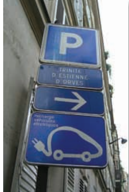
En algunas ciudades europeas, como París, ya empieza a haber espacios públicos donde recargar la batería de los coches eléctricos.

gables, que permite su funcionamiento con cero emisiones en su punto de uso y sin apenas ruido, excepto el producido por los neumáticos. En la última década hemos asistido a una profunda mejora de las baterías, reduciendo su coste y permitiendo más ciclos de carga, a la vez que ha aumentado la capacidad de almacenamiento por unidad de peso y volumen, se ha eliminado el efecto memoria y ha aumentado su duración. La mejora de las baterías va a continuar.